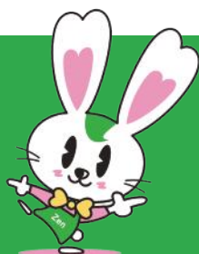
オフィシャルキャラクター ラビーちゃん