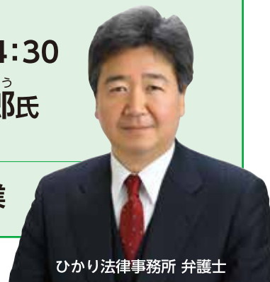
ひかり法律事務所 弁護士