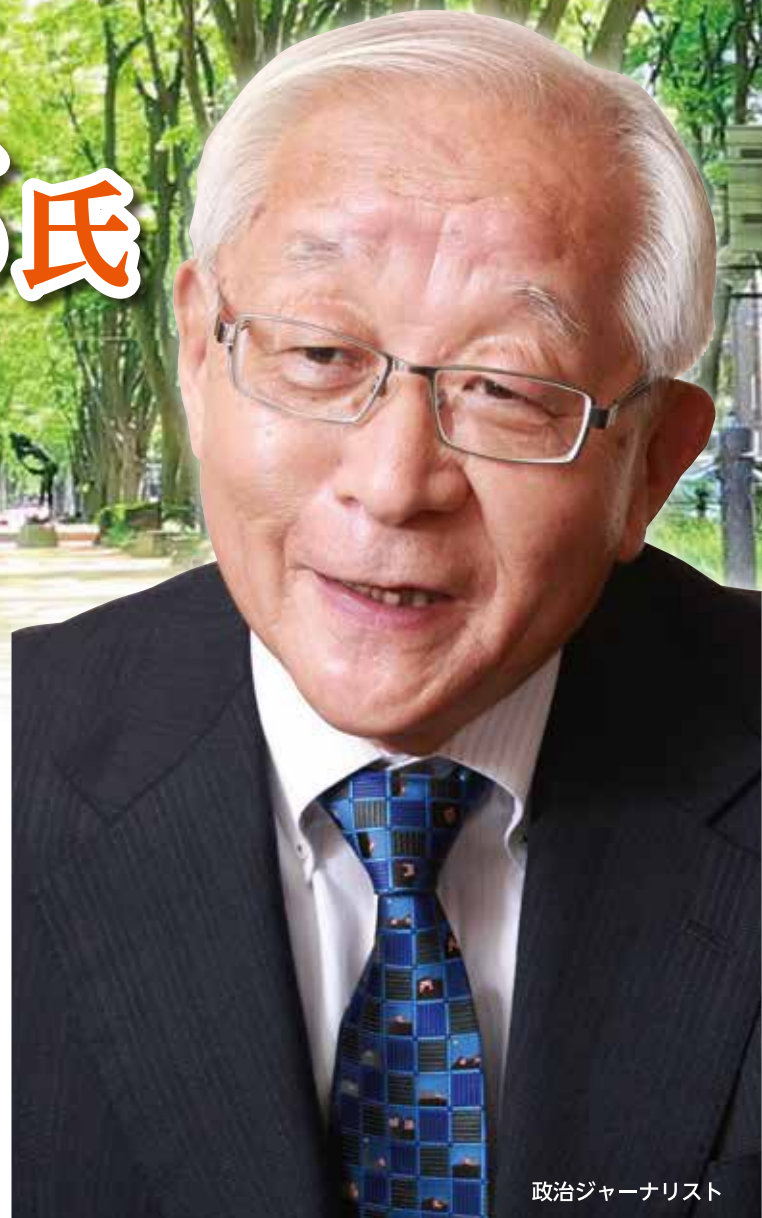
政治ジャーナリスト

交通案内 ◆ 地下鉄でご来館の方 [市営地下鉄南北線]仙台駅から市営地下鉄南北線・泉中央方面行き10分 [旭ヶ丘駅]下車、東1番出口より徒歩3分。 ◆ バスでご来館の方 バス停[旭ヶ丘駅]より徒歩2分。 ◆ お車でご来館の方 東北自動車道[仙台宮城I.C.]を降り、仙台北環状線経由約30分 東北自動車道[泉I.C.]を降り、国道4号線、県道仙台泉線経由約30分